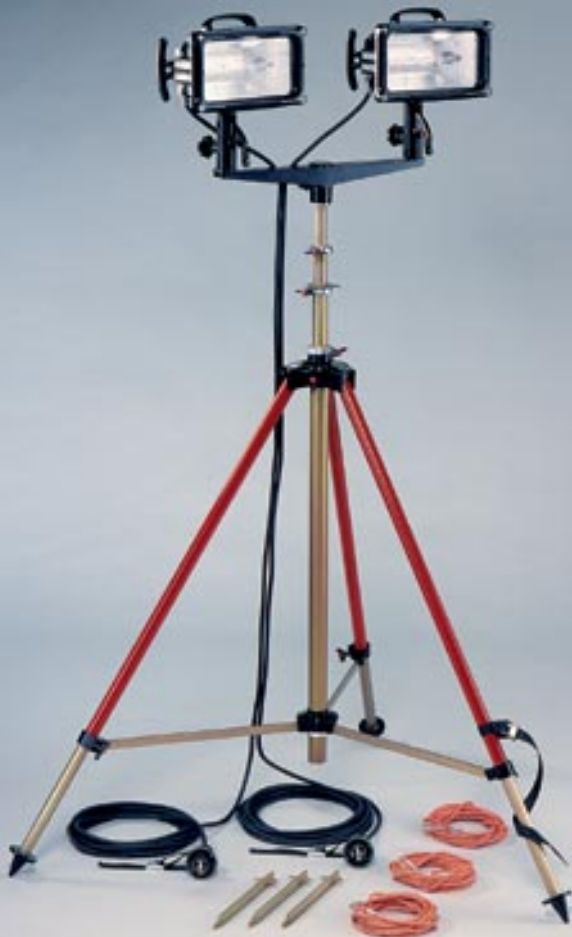
Stativ ST 4500