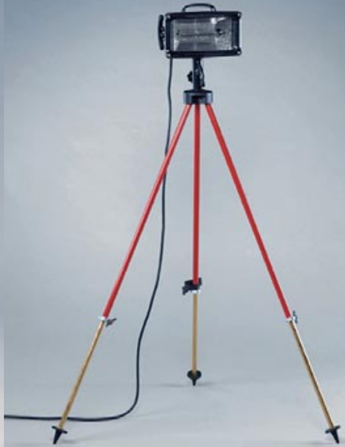
Stativ ST 1700